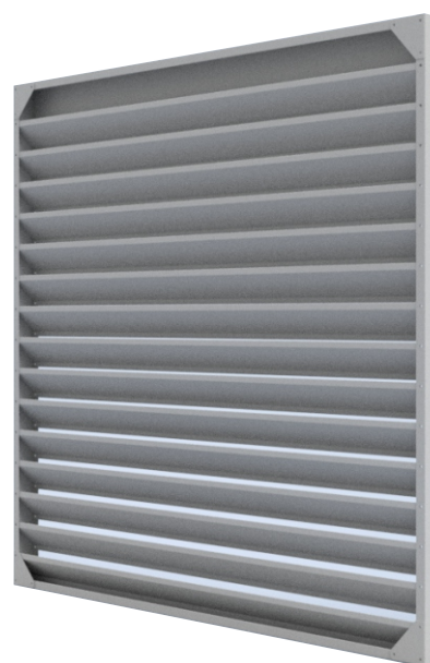
RVL 1200 x 1200